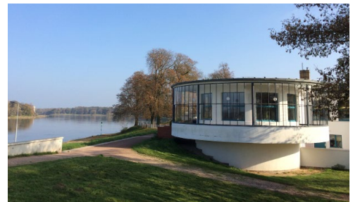
Dessau - Kornhaus