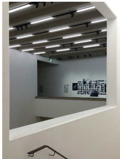
Weimar - Bauhaus Museum