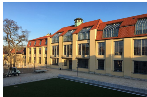
Weimar - Bauhaus- Universität, Van der Velde Bau

11.30 Ende Programm Weimar, Zeit für die Fahrt nach Dessau, Transport individuell, mögliche Zugverbindung 12.04 Uhr ab Weimar 13.47 an in Dessau, Mittagessen individuell