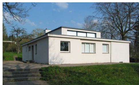
Weimar - Haus am Horn*