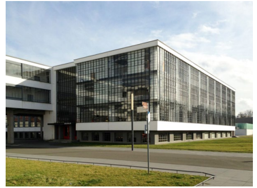
Dessau - Bauhaus Gebäude

16.00 Uhr Ende des Reiseprogramms, Abreise individuell