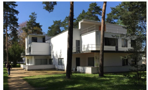
Dessau - Meisterhäuser