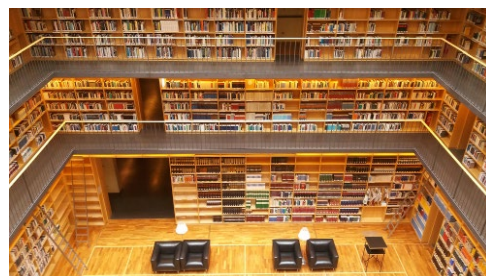
Weimar - Lesesaal Erweiterungsbau Anna-Amalia