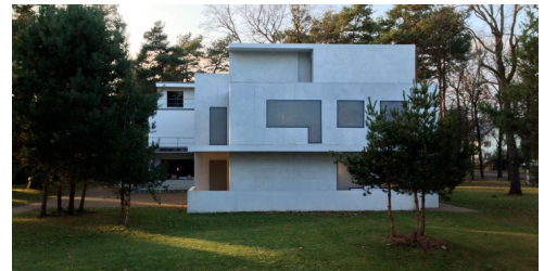
Dessau - Direktorenhaus