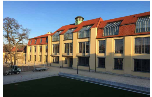
Weimar - Bauhaus- Universität, Van der Velde Bau

11.30 Ende Programm Weimar, Zeit für die Fahrt nach Dessau, Transport individuell, mögliche Zugverbindung 12.04 Uhr ab Weimar 13.47 an in Dessau, Mittagessen individuell