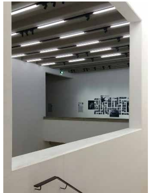
Weimar - Bauhaus Museum