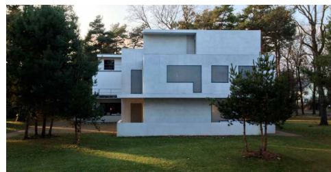
Dessau - Direktorenhaus