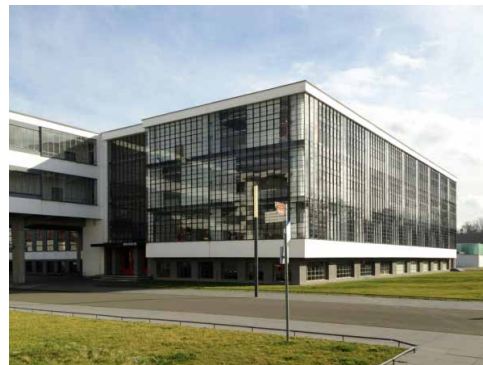
Dessau - Bauhaus Gebäude

16.00 Uhr Ende des Reiseprogramms, Abreise individuell