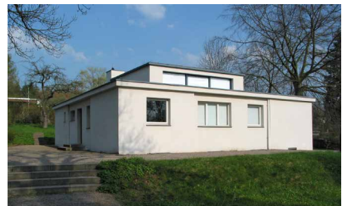
Weimar - Haus am Horn*