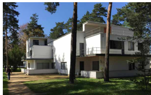
Dessau - Meisterhäuser