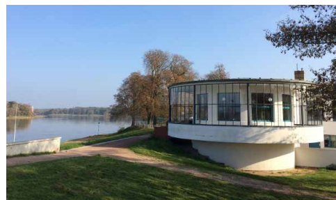
Dessau - Kornhaus