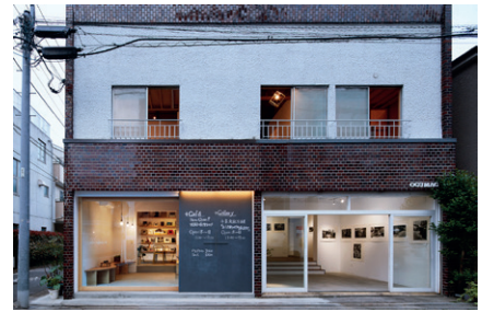
OGUMAG, Foto: Koji Okumura