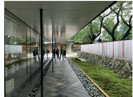
Odawara Art Foundation