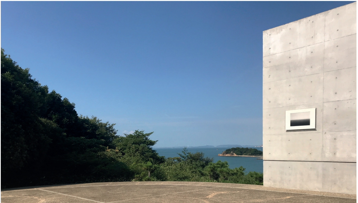
Benesse Art Site auf Naoshima

„Spätestens mittags, wenn das Sonnenlicht die Oberfläche des japanischen Binnenmeeres in einen Silberteller verwandelt, bekommt Naoshima seine auratische Atmosphäre. Vom höchsten Punkt der Insel fällt der Blick auf die Skyline der Großstadt Takamatsu und auf riesige Hängebrücken am Horizont, die zwei der vier japanischen Hauptinseln miteinander verbinden. Auf dem Hochpunkt der Insel liegt das „Chichu Bijutsukan“ („Kunstmuseum in der Erde“) von Tadao Ando, der weidlich Gebrauch von der privilegierten Lage des Museums macht, in dem es raffiniert Blicke rahmt und auf point de vues lenkt. Das Museum ist nur drei Künstlern gewidmet: Monet, Turrell und de Maria -eine ungewöhnliche Kombination! Das Museum ist der bisherige Klimax der Verwandlung der Fischerinsel in ein Gesamtkunstwerk. Auf Naoshima verbinden sich Architektur, Natur und Kunst zu einem synästhetischen Erlebnis, wie es selbst im kulturell verwöhnten Land der aufgehenden Sonne seines gleichen sucht.“