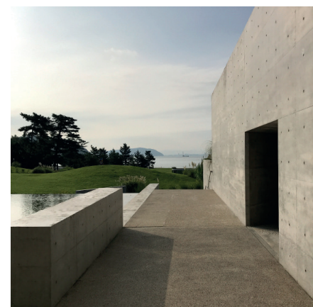
Benesse House Museum