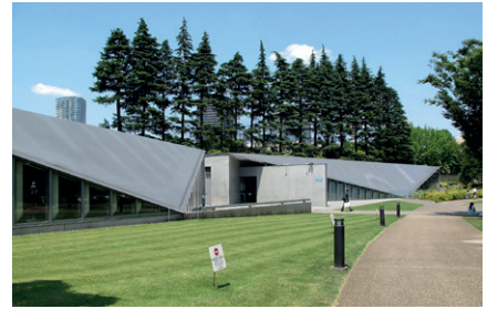
21_21 Design Sight