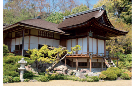
Okochi Sanso Villa