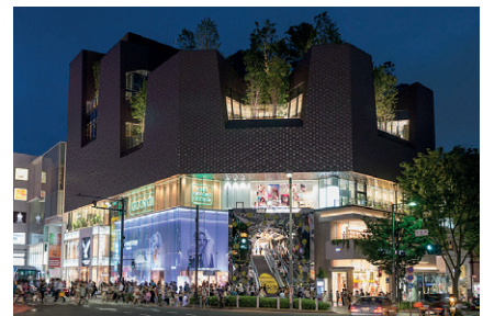
Shops auf der Einkaufstraße Omotesando