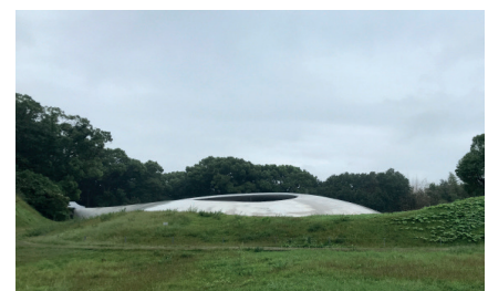
Teshima Art Museum