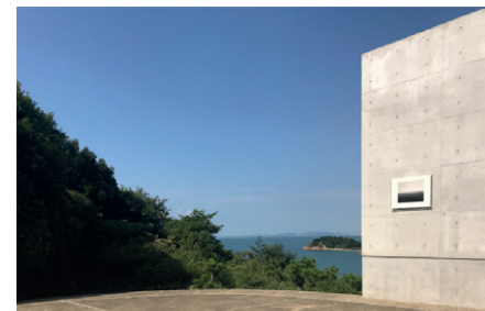
Museen auf Naoshima