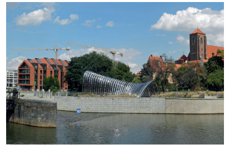
Sandinsel mit Skulptur Nawa

16.30 Uhr Ausklang des Tages im Café WUWA