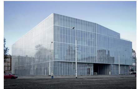
Akademie der Künste

individuelle Abreise (z.B. nach Berlin EC58 ab 15.10h - an 19.06h)