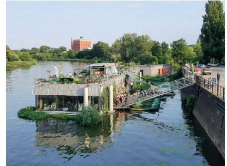
Odra-Centrum auf dem Wasser