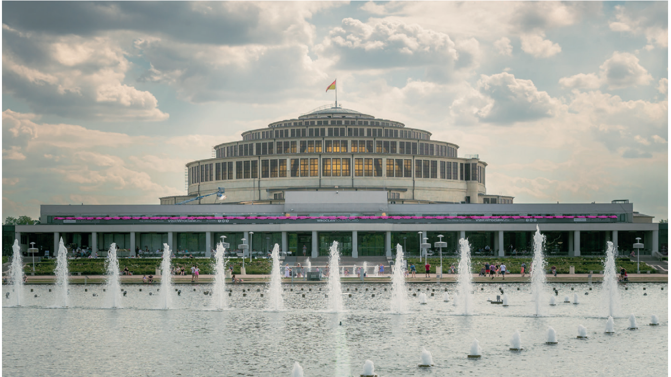
Jahrhunderthalle von Max Berg

„Wrocław hat eine Geschichte zu erzählen. Eine außergewöhnliche, tragische und interessante. Indem wir die Andersartigkeit und Multikulturalität unserer Vorgänger respektieren, haben wir ein offenes Wrocław erschaffen - ein modernes und interessantes Wrocław. Die Zeit ist gekommen, es der Welt zu präsentieren.“ Frei nach: «Raum für die Schönheit», Programm für das Kulturhauptstadtjahr