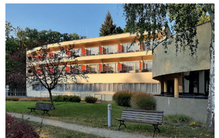
Ledigen-Wohnheim von Hans Scharoun