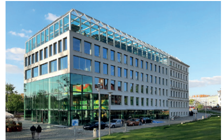
Neubau Concordia Design