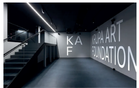
Krupa Art Foundation