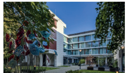
Hotel Puro am Grüngürtel Podwale

Stand: November 2025, Programmänderungen und -ergänzungen vorbehalten