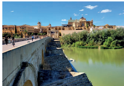
Córdoba - Puente Romano