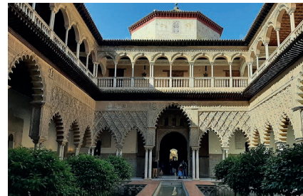
Sevilla - Real Alcázar