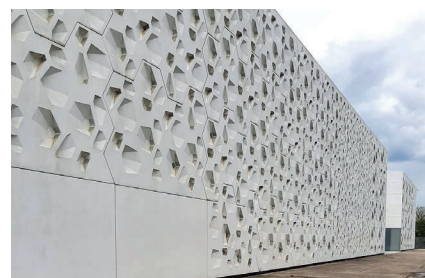
Córdoba - Kunst & Kulturzentrum C3A

Abreise individuell (Rückflug von Sevilla oder Málaga)