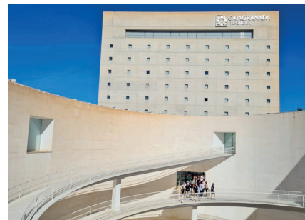
Granada - Andalusisches Gedenkmuseum