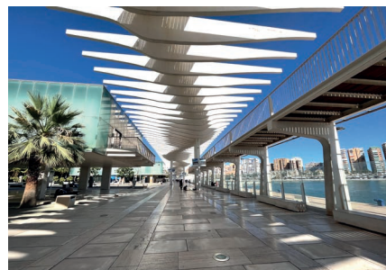
Málaga - Muelle Uno