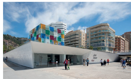
Málaga - Centro Pompidue