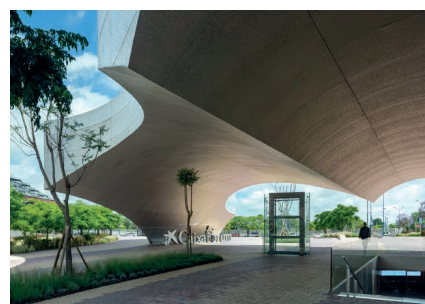
Sevilla - Caixa Forum