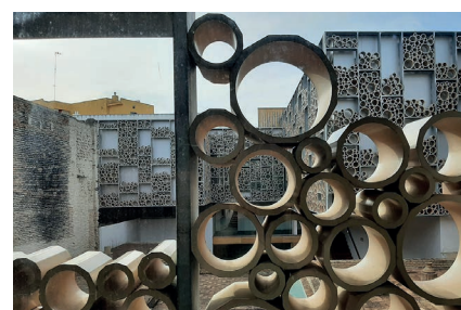
Sevilla - Keramikmuseum Triana