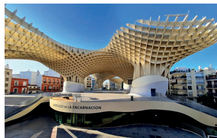
Sevilla - Metropol Parasol