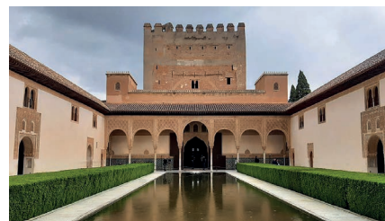
Granada - Alhambra