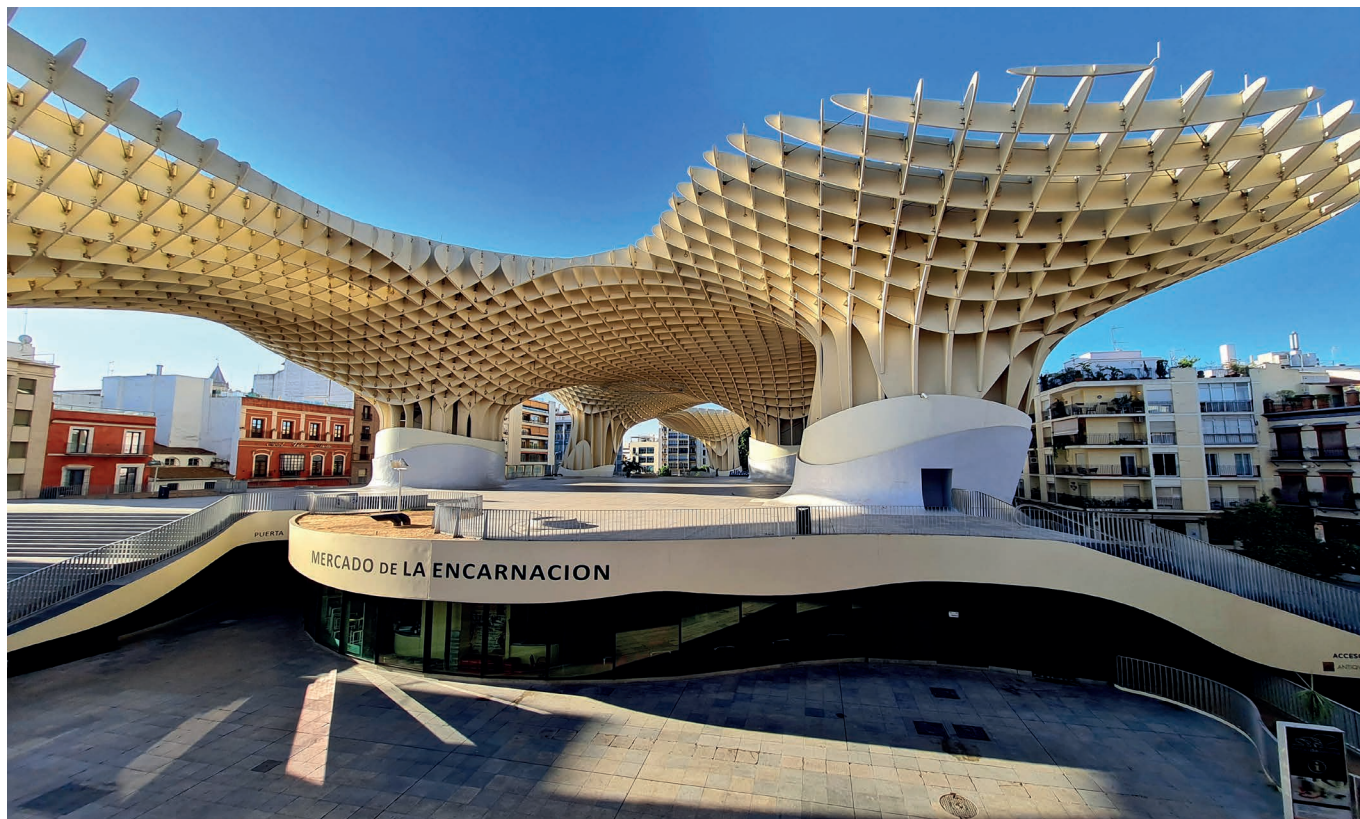
Metropol Parasol in Sevilla, Foto: GA Andalucía

Auf dieser Rundreise durch Andalusien lernen sie nicht nur die Klassiker der maurischen Architektur kennen, sondern auch eine Vielzahl hochkarätiger zeitgenössischer Bauten!