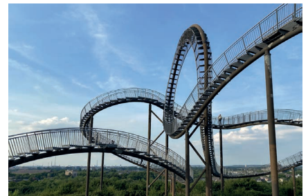
Tiger & Turtle