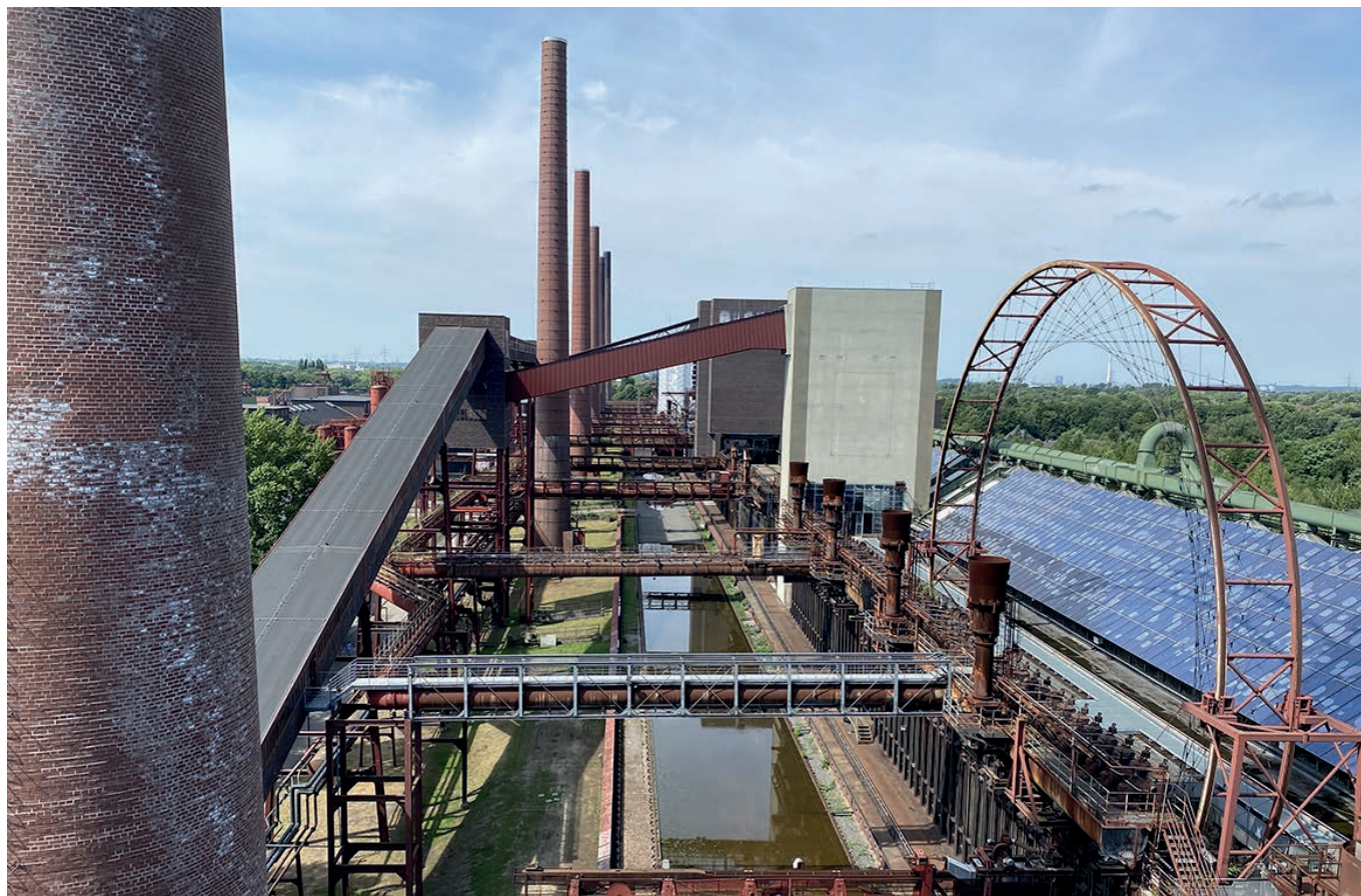
Zeche Zollverein