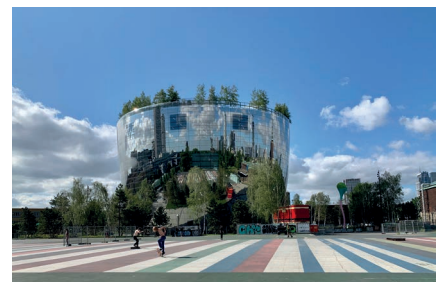
Depot Boijmans Museum