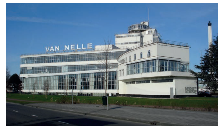
Van Nelle Fabrik