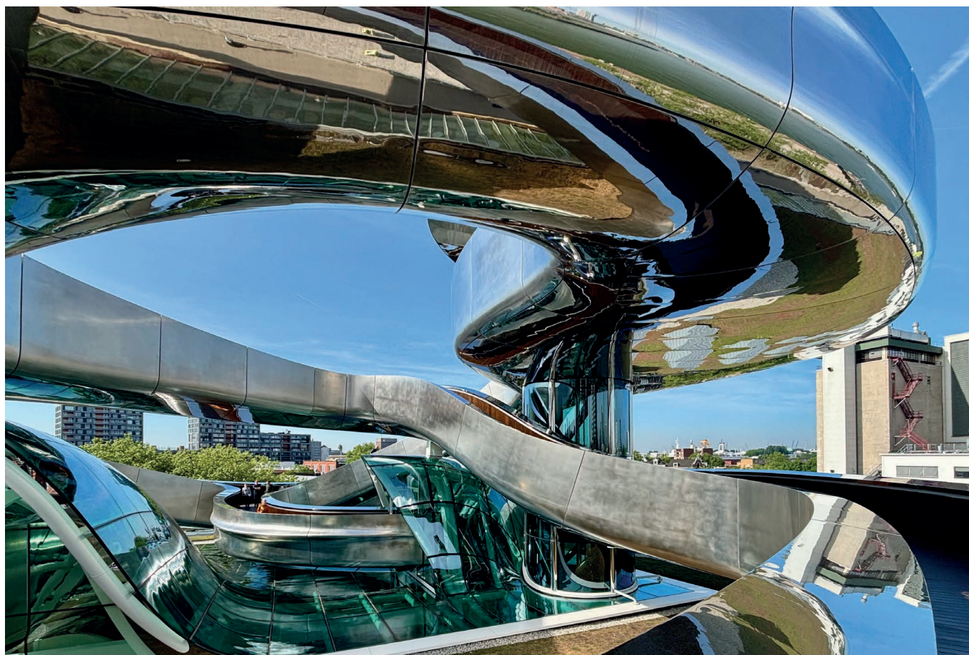
FENIX Museum of Migration, Foto: Anneke Bokern

Rotterdam ist eine Hafenstadt mit rauhem Charme und glitzernder Skyline.