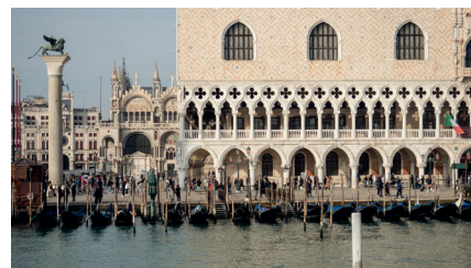
Dogenpalast an der Piazza San Marco