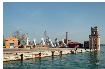
Biennale – Ausstellungsgelände am Arsenal