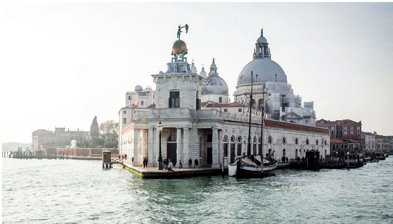
Punta della Dogana

Entdecken Sie mit Ticket B die Kunstbiennale in Venedig und lernen Sie die Stadt von einer anderen Seite kennen!